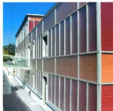
Die Fassadenumhüllung mit Lucido – an der Nordfassade ist sie Wärmedämmung.

sorberelement durch die Verrippung verschattet und die Überhitzung der Fassade vermieden. Bei hohem Sonnenstand wird die Strahlung reflektiert und überschüssige Wärme durch die natürliche Thermik im Luftzwischenraum weggelüftet. Die Messungen haben als gemittelte Temperaturen für Juni bis August hinter dem Absorber für die Südfassade 27°C ergeben, für die Nordfassade 23°C.