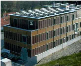
Auf dem Dach liefern 20 m 2 thermische Kollektoren und eine 60 m 2 Fotovoltaikanlage Energie.

Der von satiniertem Glas umhüllte Baukörper wirkt wie ein Statement zur neueren Architektur, die zurzeit eine Vorliebe für allseitige Vollverglasungen hat. Oft werden Doppelfassaden eingesetzt, bei denen die einzelnen Fassadenschichten funktionell entlastet sind und mit denen minimierte, klare Architekturformen generiert werden können. Diesen derzeitigen ästhetischen Vorstellungen kommt das Fassadensystem Lucido entgegen: Hinter einer Hülle von satiniertem Glas erzeugt ein gleichmässig gerippter Absorber aus Lärchen- oder Fichtenholz genau diesen Eindruck von strukturierter, immaterieller