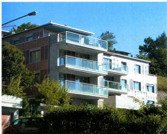
Mehrfamilienhaus mit fünf Eigentumswohnungen zu erschwinglichen Preisen.